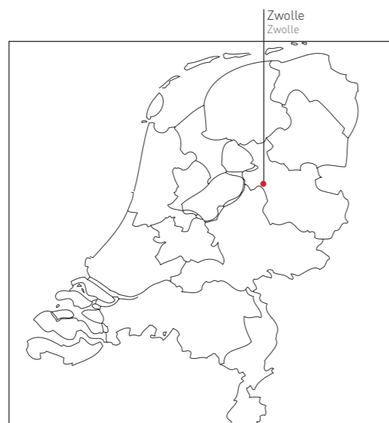
Zwolle | in the Netherlands