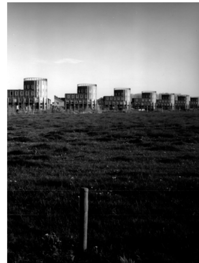
9301 Oldenelerbroek, Zwolle