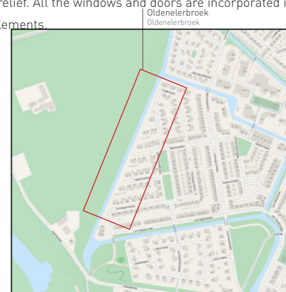
Locatie Oldenelerbroek | location